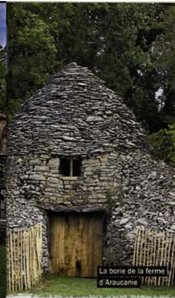
La borie de la ferme d'Araucanie

• Logis pour 4 personnes : 1450 €/sem. en moyenne saison, 2500 € en haute saison (juillet/août). Pour 8 personnes : 1950 € en moyenne saison, 2500 € en haute saison. Week-end en moyenne saison : entre 650 € et 950 €. Basse saison sur demande. Piscine chauffée, grand jardin. Marie-Isabelle Van Hove, Le Bas Portail, 24390 Tourtoirac. Tél. : 06 81 68 80 02. Et www.gite-araucanie.com