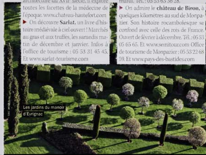
Les jardins du manoir d'Eyrignac

► On admire le château de Biron, à quelques kilomètres au sud de Monpazier. Son histoire rocambolesque se confond avec celle des rois de France. Ouvert de février à décembre. Tél. : 05 53 05 65 65. Et www.semitour.com Office de tourisme de Monpazier : 05 53 22 68 59. Et www.pays-des-bastides.com