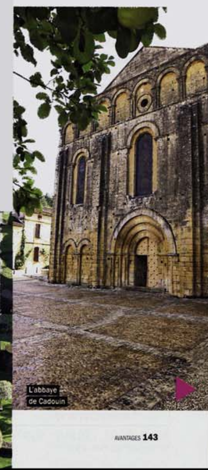
L'abbaye de Cadouin